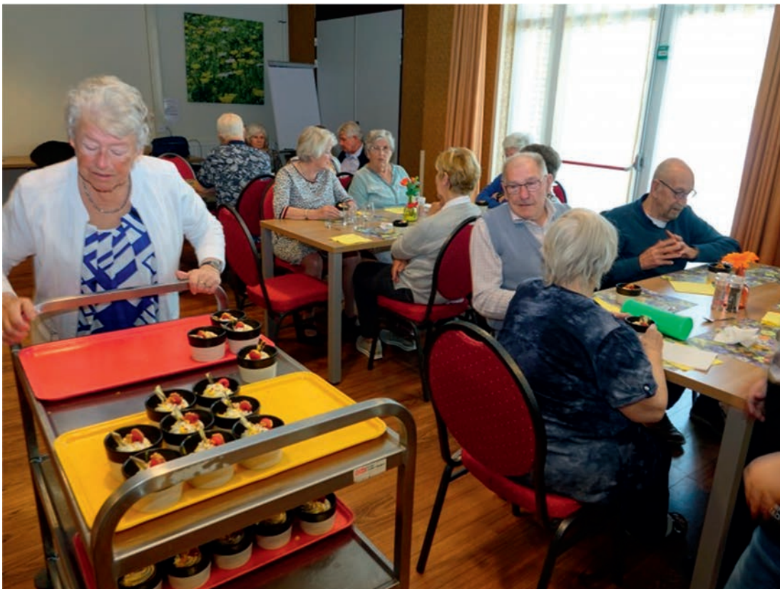
Foto: 10 jaar Open Eettafel